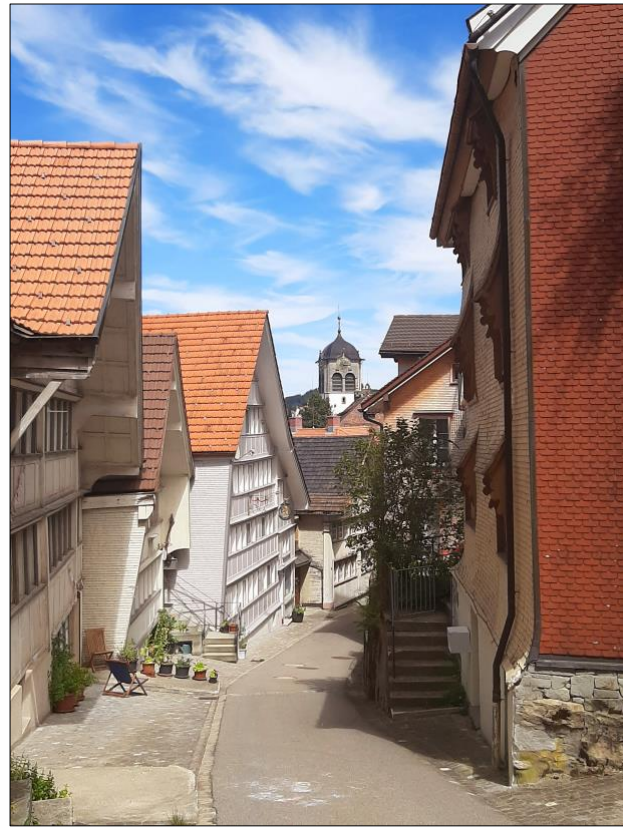
Ruelle tortueuse de Trogen (AR)

Au centre de Trogen, l'église baroque impressionne par sa façade à colonnes imposantes donnant accès à des décors intérieurs somptueux. Les divers styles architecturaux du village cohabitent dans une parfaite harmonie et en font un site construit d'une grande valeur patrimoniale. Le repavage complet en cours du centre promet une sublimation esthétique des lieux, alors que l'auberge Krone atteint déjà un sommet de ravissement.