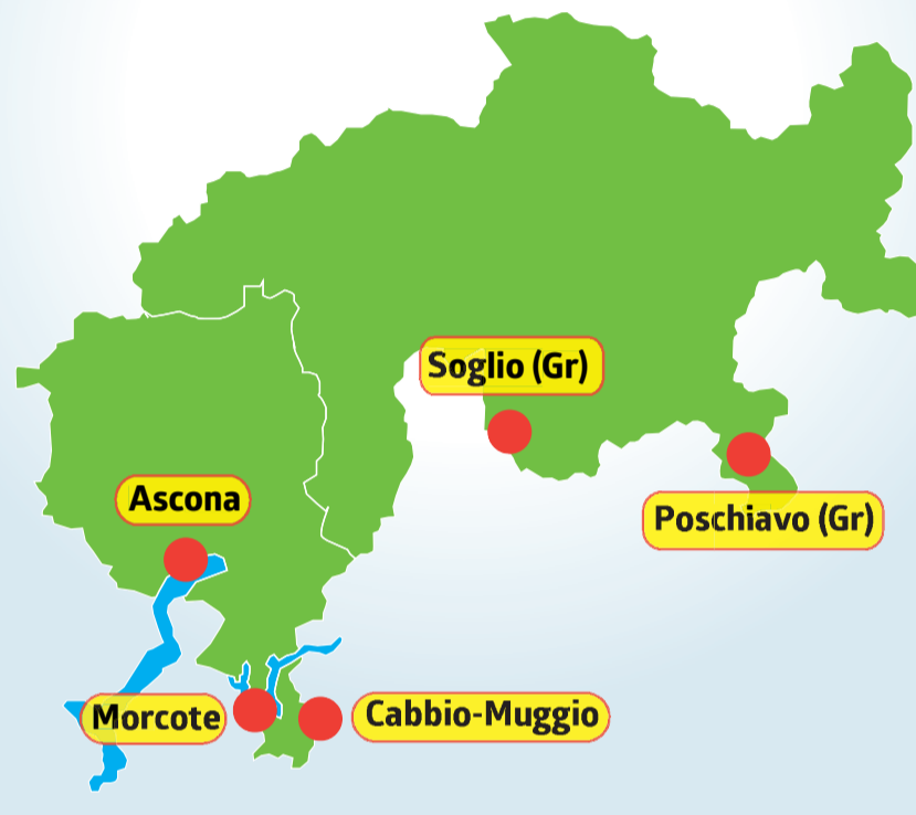
La mappa dei più belli